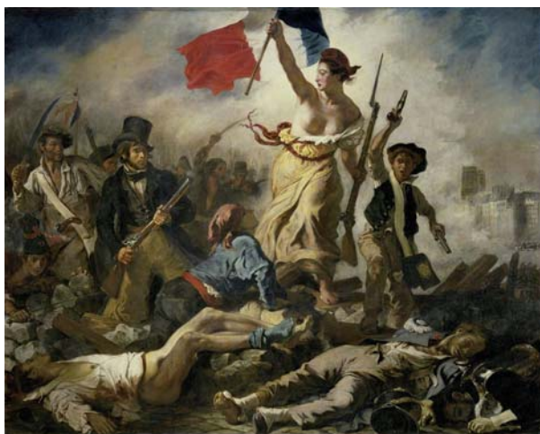
Fig.1 Puntuación máxima: 2 puntos

Analiza y comenta las dos obras de arte presentadas: