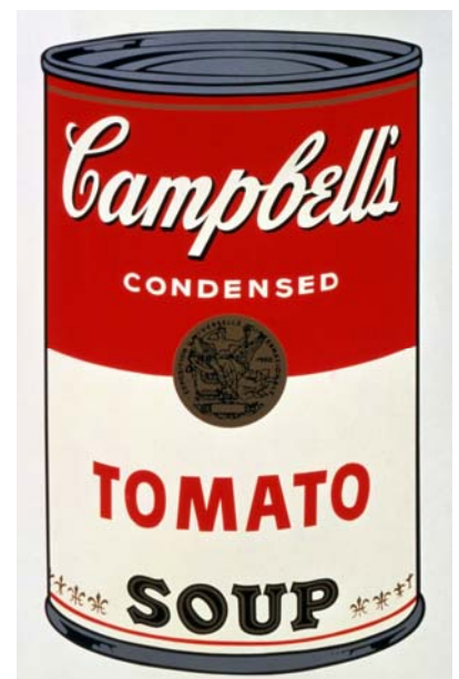
Fig.2 Puntuación máxima: 2 puntos