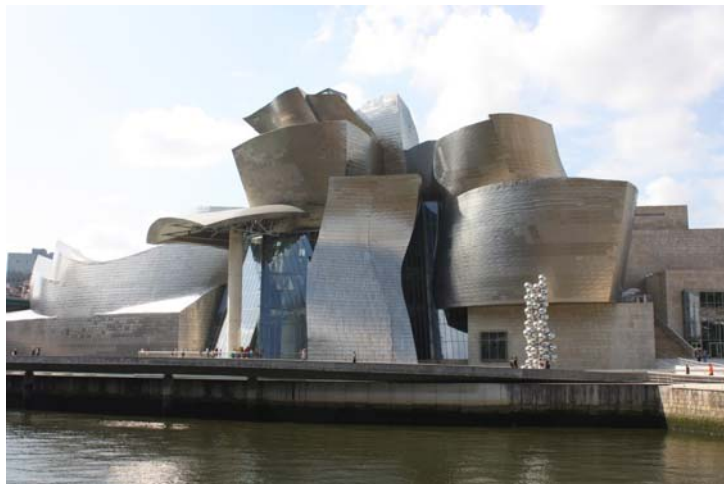
Fig.2 Puntuación máxima: 2 puntos